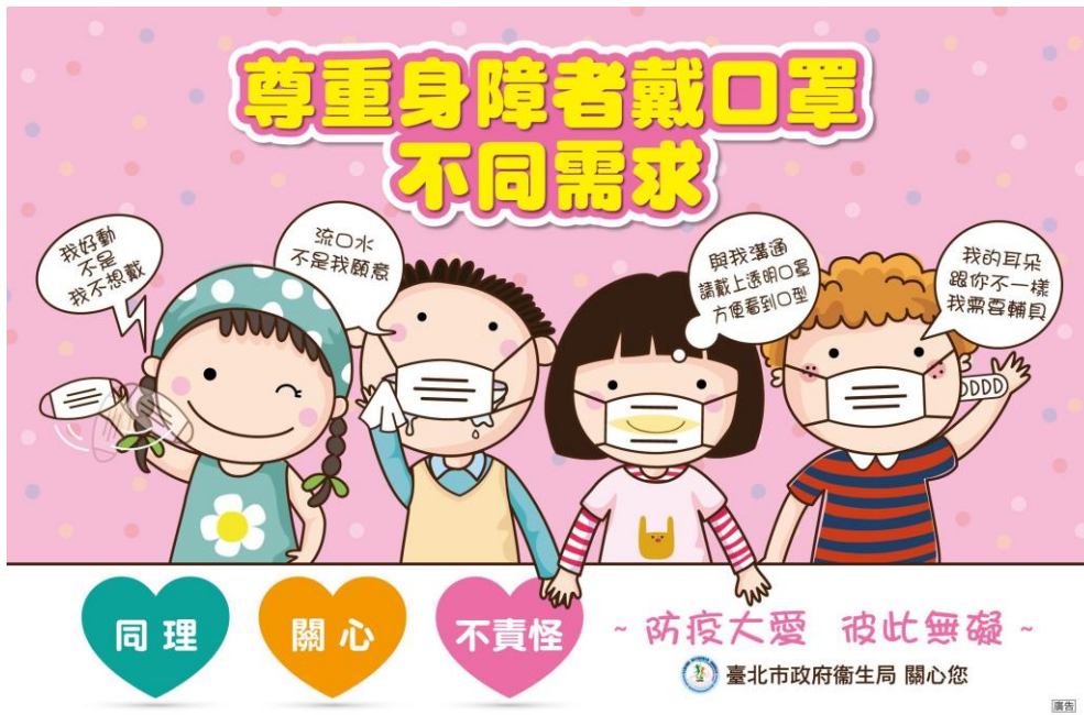
圖 1 (參考圖)