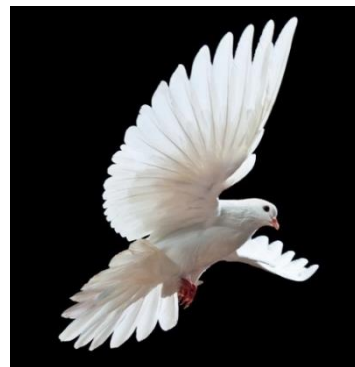
術科試題範例之參考物體圖片